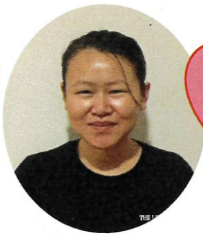
ホーティ チェックリー